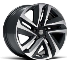
PERFORMANCE 18" 37/1 pneumatik 235/55