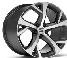
EXCLUSIVE 19" 37/1 Cosmo Grey pneumatik 255/45