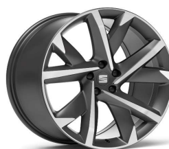
SUPREME 20" 37/3 pneumatik 255/40