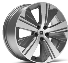
EXCLUSIVE 19" 37/1 Machined pneumatik 235/50