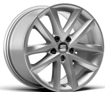
DYNAMIC 17" 37/1 pneumatik 215/65