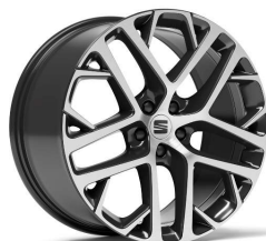
SUPREME 20" 37/2 pneumatik 235/45