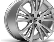
DYNAMIC 17" 30/3 pneumatik 225/45