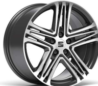
PERFORMANCE 18" 30/8 pneumatik 225/40