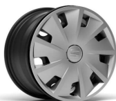
Ratkapne URBAN 15" pneumatik 195/65