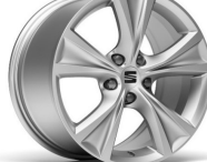
DYNAMIC FR 17" 30/2 pneumatik 225/45