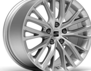
DYNAMIC 17" 30/1 pneumatik 225/45