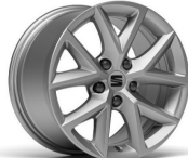
DESIGN 16" 30/2 pneumatik 205/55