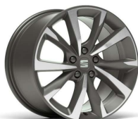
PERFORMANCE 18" 30/5 pneumatik 225/40