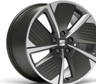
PERFORMANCE 18" 30/11 pneumatik 225/40

Sve cene u cenovniku su neobavezujuće, preporučene cene uključujući PDV, ako nije drugačije navedeno. U retkim slučajevima postoji mogućnost da cene nisu aktuelne. Molimo kontaktirajte Vašeg prodavca za detaljnu kalkulaciju cene. Zadržavamo pravo promena u modelima, varijantama opreme, konstrukciji, opremi, tehničkim podacima, cenama i greškama prilikom unosa podataka. Prikazana vozila u nekim slučajevima prikazuju dodatnu opremu koju je moguće naručiti uz doplatu i koja nije dostupna za sve varijante modela. Molimo Vas informišite se pre zaključivanja ugovora o dodatnoj i serijskoj opremi kao i o tačnoj ceni vozila. Cene su izražene u EUR, plaćanje se vrši isključivo u dinarskoj protivvrednosti na dan izdavanja fakture. Cenovnik važi od 01.07.2022. godine.