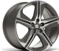
PERFORMANCE 18" 30/9 pneumatik 225/40