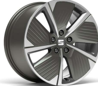
PERFORMANCE 18" 30/10 pneumatik 225/40