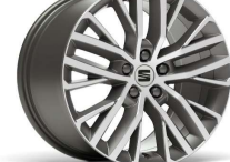
PERFORMANCE 18" 30/4 pneumatik 225/40