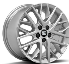
DESIGN Brilliant Silver 16" pneumatik 195/55