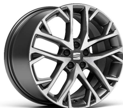
DYNAMIC MACHINED 17" 20/1 pneumatik 215/45