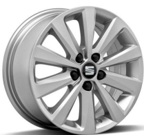
ENJOY Brilliant Silver 15" pneumatik 185/65