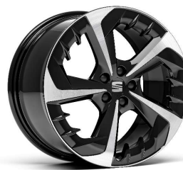
PERFORMANCE MACHINED 18" pneumatik 215/40

Sve cene u cenovniku su neobavezujuće, preporučene cene uključujući PDV, ako nije drugačije navedeno. U retkim slučajevima postoji mogućnost da cene nisu aktuelne. Molimo kontaktirajte Vašeg prodavca za detaljnu kalkulaciju cene. Zadržavamo pravo promena u modelima, varijantama opreme, konstrukciji, opremi, tehničkim podacima, cenama i greškama prilikom unosa podataka. Prikazana vozila u nekim slučajevima prikazuju dodatnu opremu koju je moguće naručiti uz doplatu i koja nije dostupna za sve varijante modela. Molimo Vas informišite se pre zaključivanja ugovora o dodatnoj i serijskoj opremi kao i o tačnoj ceni vozila. Cene su izražene u EUR, plaćanje se vrši isključivo u dinarskoj protivvrednosti na dan izdavanja fakture. Cenovnik važi od 01.07.2022. godine.