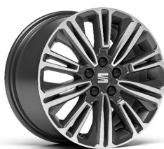
DESIGN MACHINED 16" 20/3 pneumatik 195/55