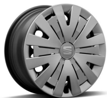
Ratkapne URBAN 15" pneumatik 185/65