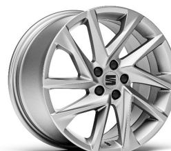
DYNAMIC Brilliant Silver 17" pneumatik 215/45